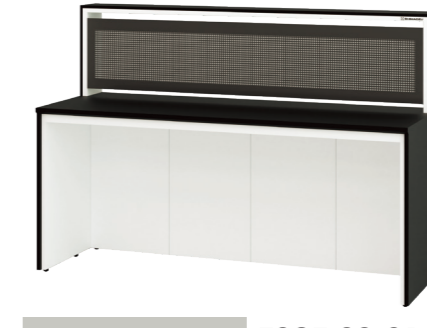
パンチングユニット付 ESQF-SS-CA