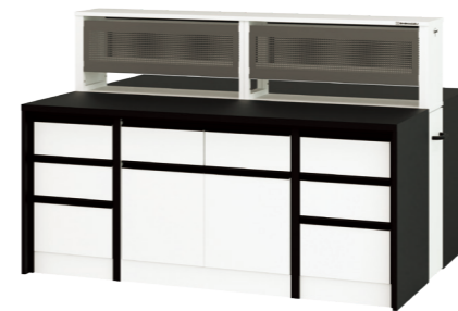
両開き戸タイプ ESQ1-NL-CA パンチングパネルユニット付