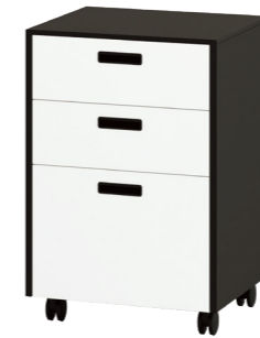
ワゴン 3段引出タイプ