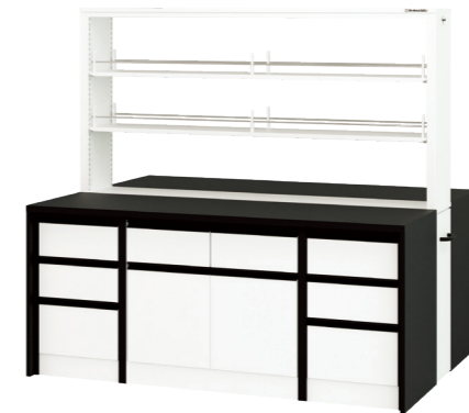
両開き戸タイプ ESQ1-NL-BF4 試薬棚付