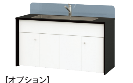
【オプション】 側面流し台 ESQ1-SL