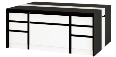
大型収納引き出しタイプ ESQ5-NL