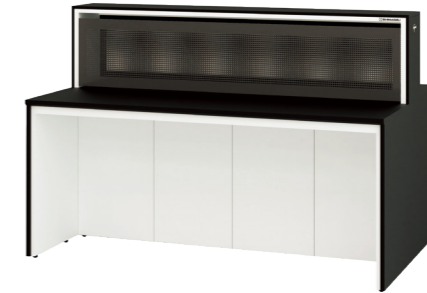
パンチングユニット付 ESQF-SNL-CA