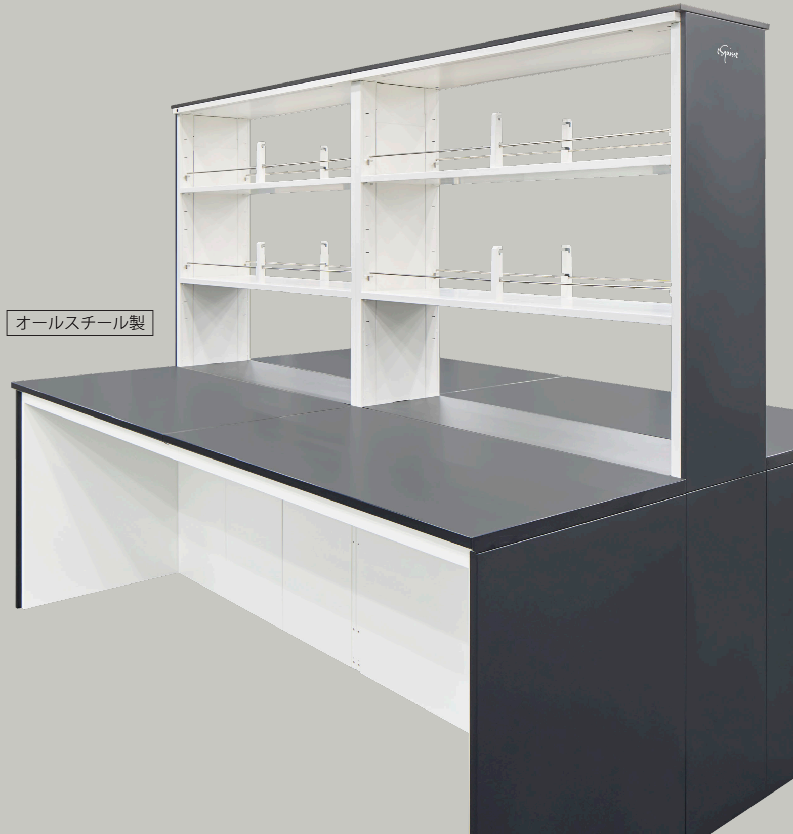
オールスチール製