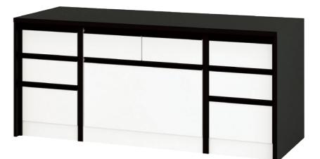
大型収納引き出しタイプ ESQ5-PA