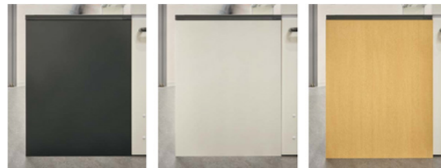
ブラック ホワイト 木目調