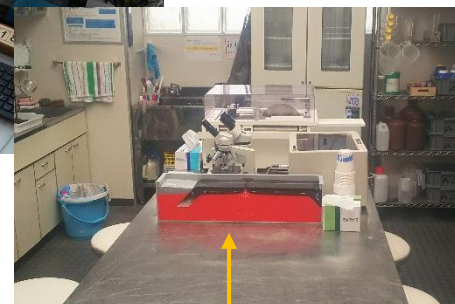
プレートテクトニクス実験器