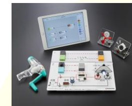
プログラミング学習