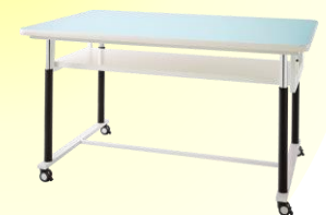
アクティブ実験台